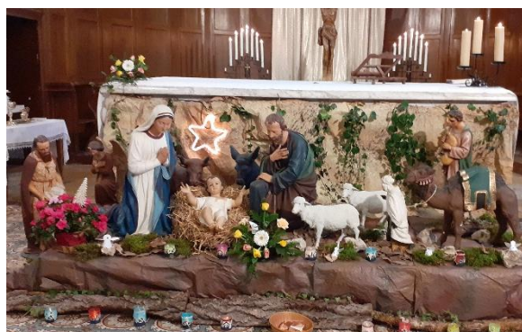
Crèche de l'église de Pontailier

mercredi 14 janvier à 19h, presbytère de Pontailier