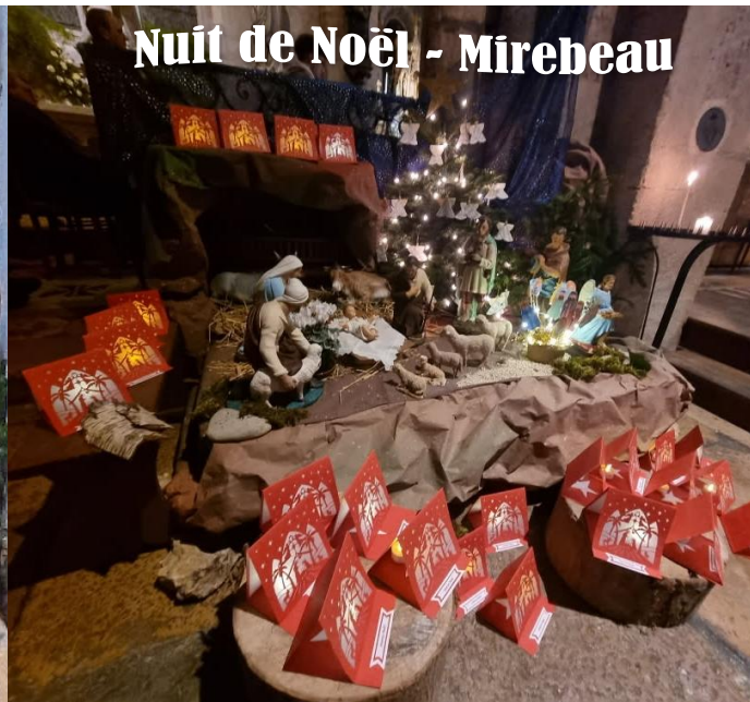
Nuit de Noël - Mirebeau