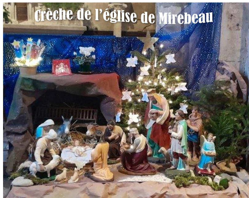
Crèche de l'église de Mirebeau