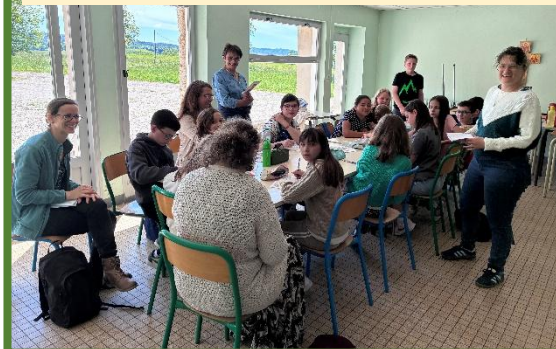
Retraite de Première Communion, Profession de Foi et Confirmation des jeunes de Mirebeau et Pontailier à l'abbaye d'Acéy